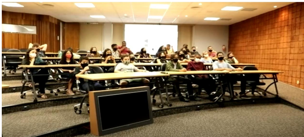
Print extraído do canal Youtube, durante a ação educativa do Projeto Algar

Para terem acesso à ação educativa, ela também foi disponibilizada no canal Youtube para todo o nosso público ( Clique aqui )