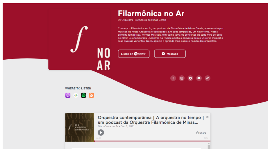
Print do relatório da plataforma de criação de podcast – Anchor