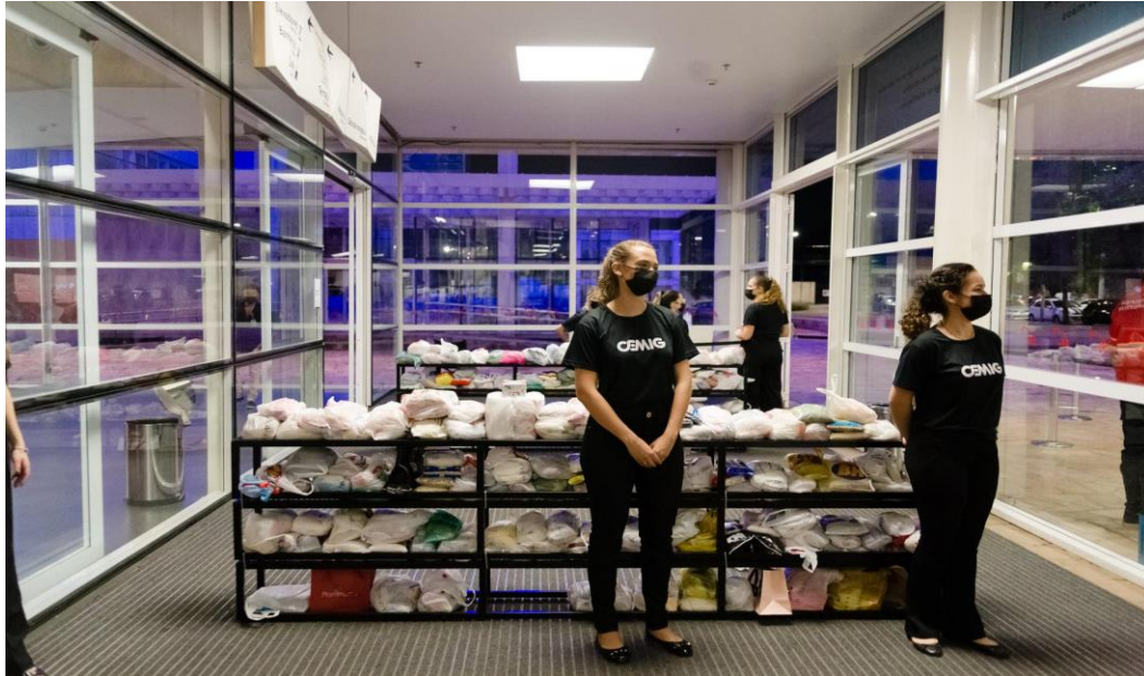
Concerto Especial Beneficente em parceria com a CEMI, em 22/11/2021.

primeira vez à música de concerto e à Sala Minas Gerais, e acompanharam um repertório extraordinário com obras de Strauss Jr., Beethoven, Dvorák, Piazzolla, Villa-Lobos e Ravel.