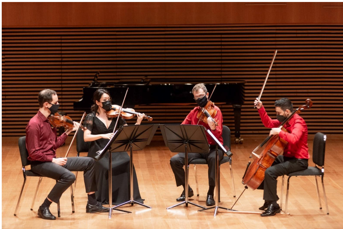
Concerto Filarmônica em Câmara | Verdi, Bax e Schubert, do dia 30/11/21.