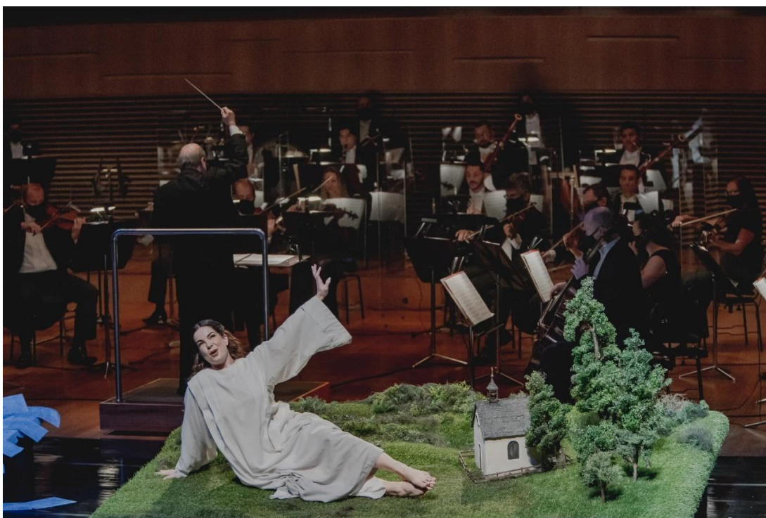
Cartas Portuguesas, de João Guilherme Ripper, 10/06/2021

Uma equipe de profissionais silenciosamente trabalhou nos bastidores para que este trabalho chegasse à casa de milhares de pessoas, com cerca de 5.903 visualizações. A estreia da ópera Cartas Portuguesas em solo mineiro foi registrada e contada neste documentário. Assista Portuguesas na íntegra em (Clique Aqui)