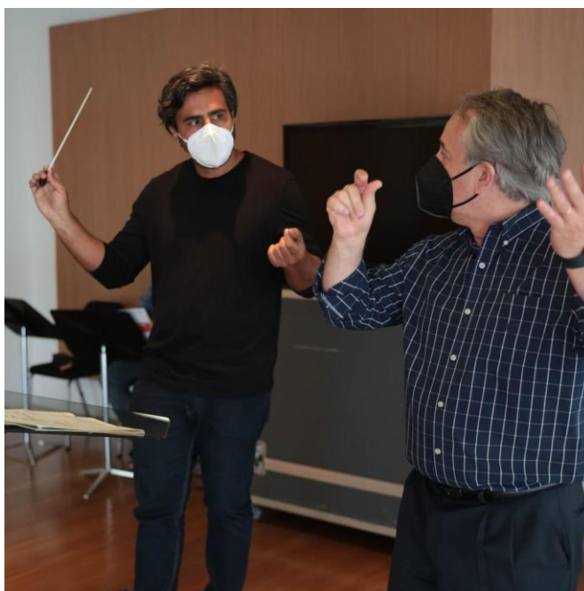
(Masterclass do 13º Laboratório de Regência)