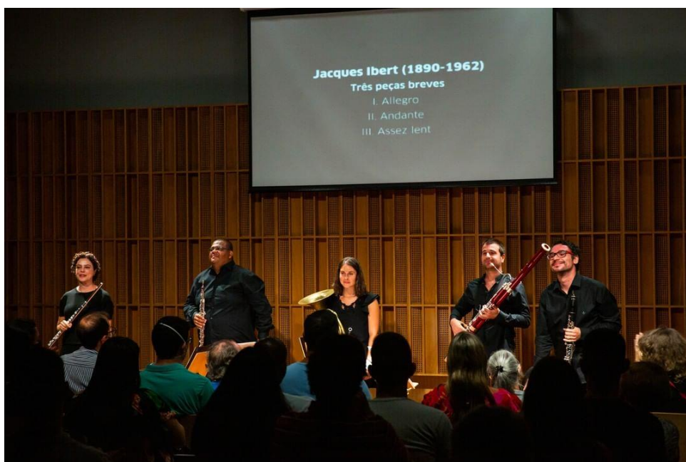
(Quinteto de Sopros, Sala Cecília Meireles, 11/05/2022)

A colaboração artística inclui 4 (quatro) concertos para a Série Música de Câmara da SCM, com apresentações que vão de março à agosto deste mesmo ano. Os grupos participantes são o Quinteto de Sopros, o Quinteto de Metais, o Grupo de Percussão e o Quarteto de Cordas da Orquestra Filarmônica de Minas Gerais.