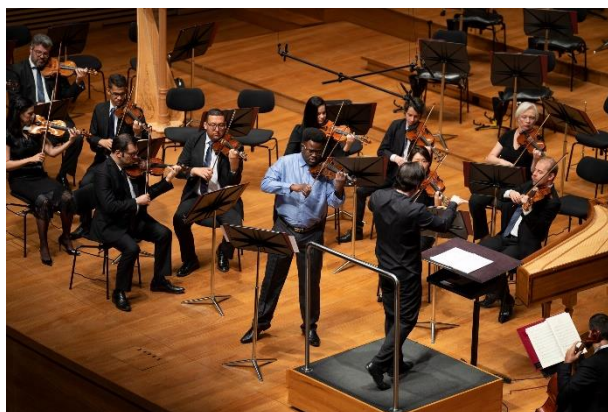
Juventude 5 (Foto de Eugênio Sávio, 16/10/2022)

Clique aqui para ter acesso a fonte de comprovação do indicador.