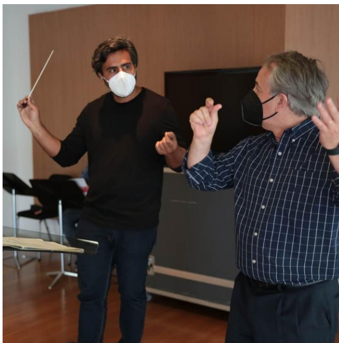
(Masterclass do 13º Laboratório de Regência)