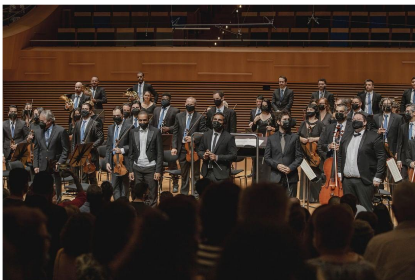
(Concerto de Encerramento 13º Lab. de Regência)

Clique aqui para ter acesso a fonte de comprovação do indicador.