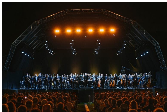
(Concerto aberto no jardim da Torre de Belém)

O repertório foi dedicado a compositores brasileiros, especialmente, Villa-Lobos, grande expoente nacional, com a apresentação do Choros nº 6 , das Bachianas Brasileiras nº3 , e também da Abertura e Alvorada da Ópera 'O Escravo', de Carlos Gomes. Para ter acesso ao Programa de concerto completo, clique aqui .