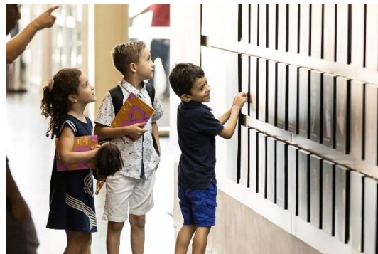
Juventude 1 (Foto: Rafael Motta, 28/03/2023)