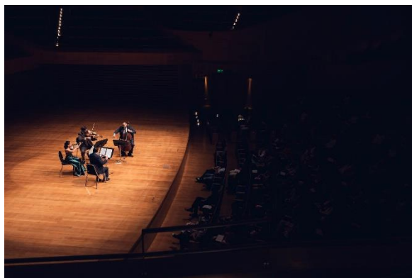
Filarmônica em Câmara 1 (Foto: Luciano Viana, 14/03/2023)