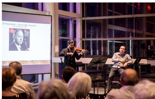
Comentados (Foto: Daniela Paoliello, 30/03/2023)