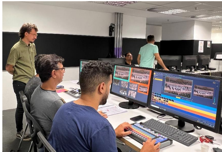
Equipe de transmissão