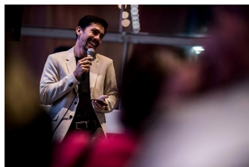
Comentados (Foto: Alexandre Rezende, 23/03/2023)