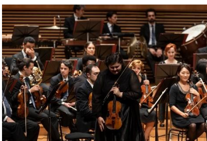
Fora de série 1 (Foto: Rafael Motta, 18/03/2023)