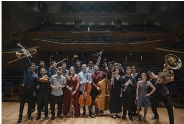
Alunos da Academia Filarmônica

Com um programa educacional de alto nível pedagógico, a Academia tem como objetivo preparar e