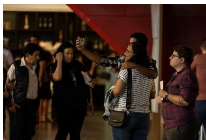
Fora de série 1