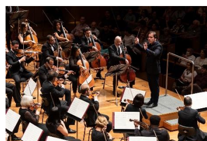
Fora de série 1 (Foto: Rafael Motta, 18/03/2023)