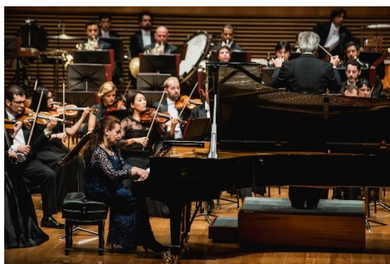
Presto 1 (09/03/2023)