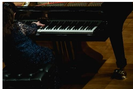
Lilya Zilberstein