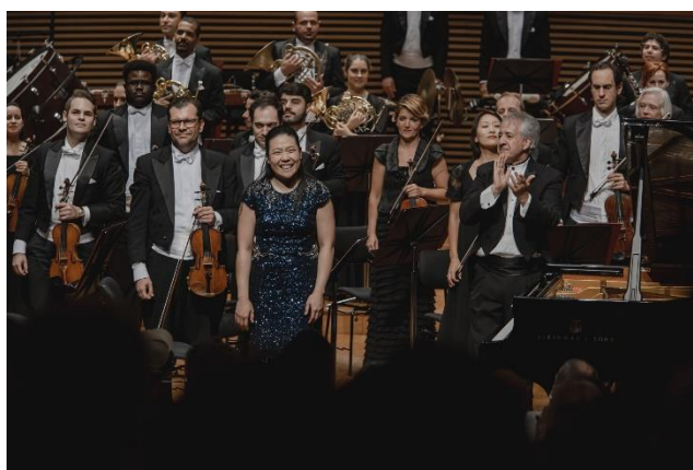
Vivace 1 (03/03/2023)