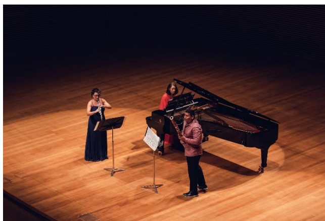
Filarmônica em Câmara 1 (Foto: Luciano Viana, 14/03/2023)