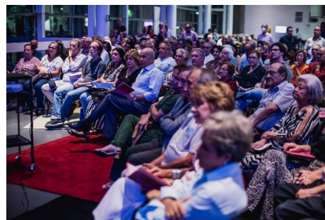
Comentados (Foto: Alexandre Rezende, 09/03/2023)