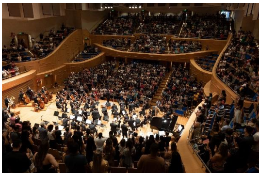
Juventude 1 (Foto: Rafael Motta, 28/03/2023)