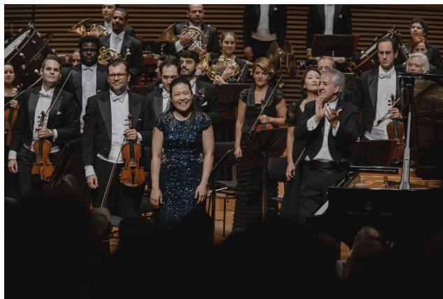
Vivace 1 (Foto: Bruna Brandão, 03/03/2023)