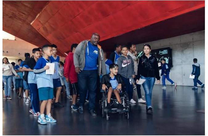
Acervo Filarmônica, Didáticos 2023