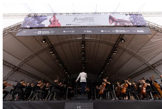
Praça 3, Foto: Rafael Motta