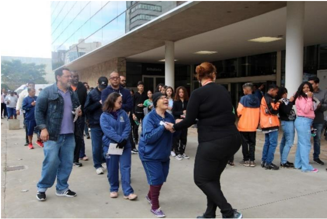
Acervo Filarmônica, Didáticos 2023