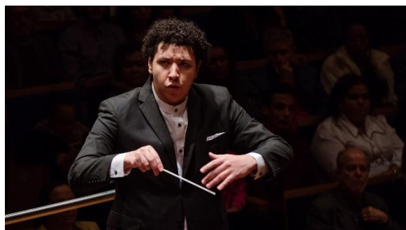
14º Lab. Regência