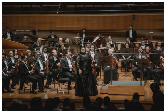
Allegro 2, 23/03/2023