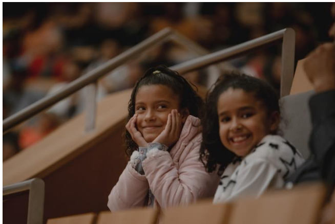
Acervo Filarmônica, Didáticos 2023