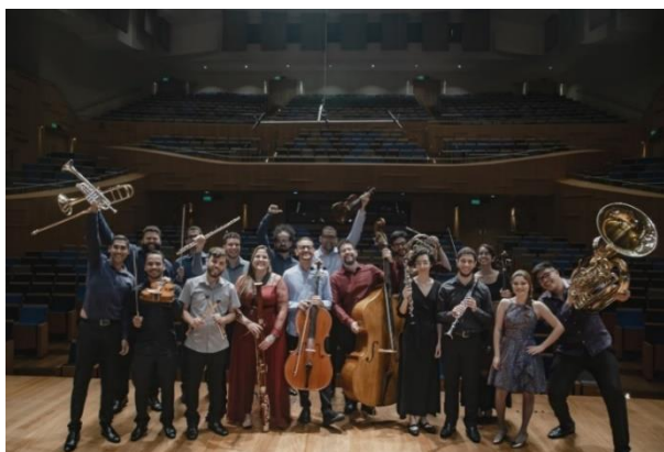
Alunos da Academia Filarmônica

Com um programa educacional de alto nível pedagógico, a Academia tem como objetivo preparar e