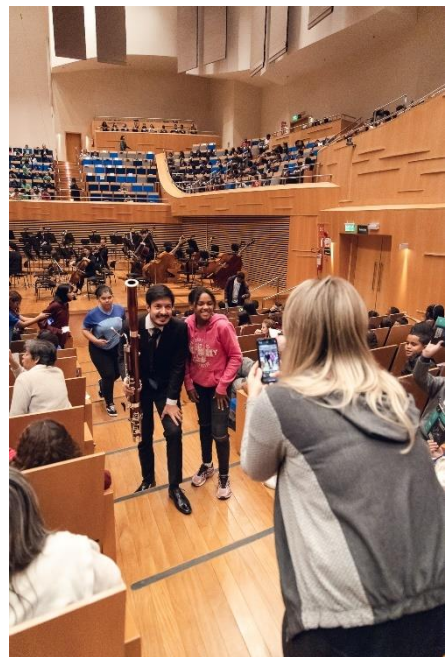
Acervo Filarmônica, Didáticos 2023