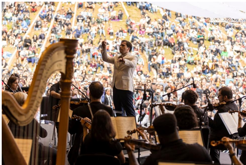
Praça 3, Foto: Rafael Motta