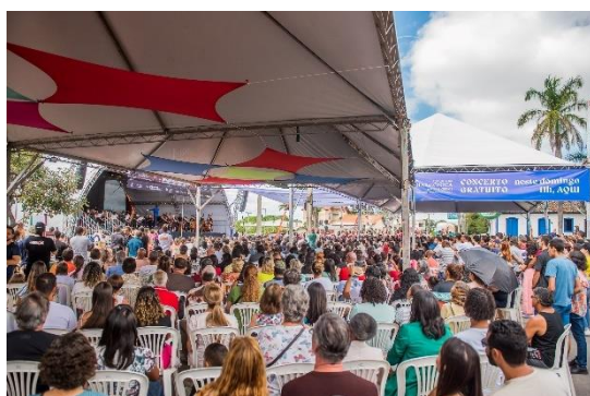
Praça 1