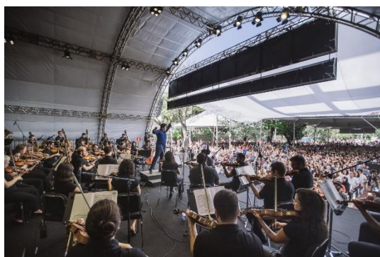
Praça 2, Foto: Bruna Brandão