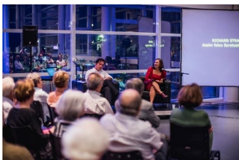
Comentados (Foto: Alexandre Rezende, 09/03/2023)

A palestra acontece no foyer do 2º andar da Sala Minas Gerais e tem duração aproximada de 30 (trinta) minutos. As séries de concertos contempladas são Allegro, Vivace, Presto e Veloce. A curadoria do projeto é do regente associado da Filarmônica, maestro José Soares.