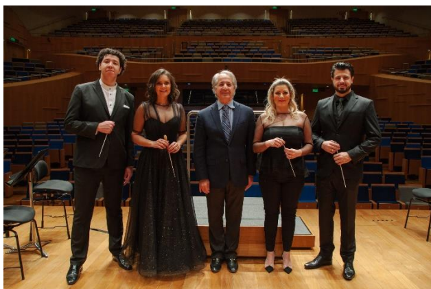
Encerramento 14º Lab. Regência