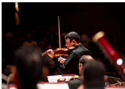
Vadim Gluzman