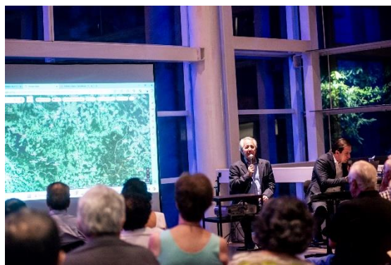
Comentados (Foto: Daniela Paoliello, 15/03/2024)