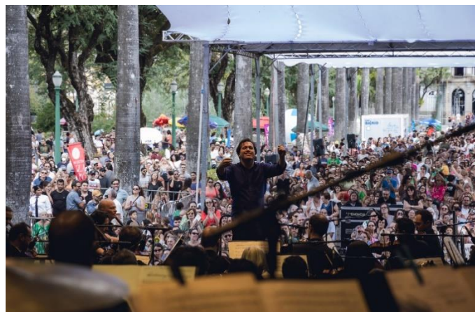
Praça 2, Foto: Luciano Viana