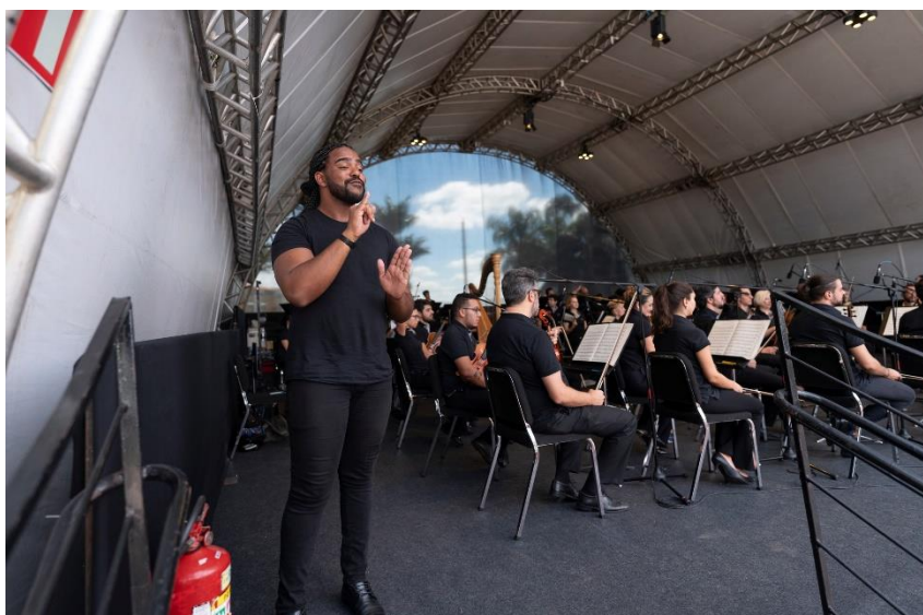
Praça 1, Foto: Eugênio Sávio