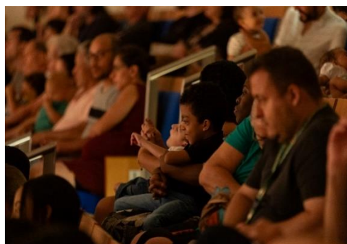
Juventude 1 (17/03/2024)