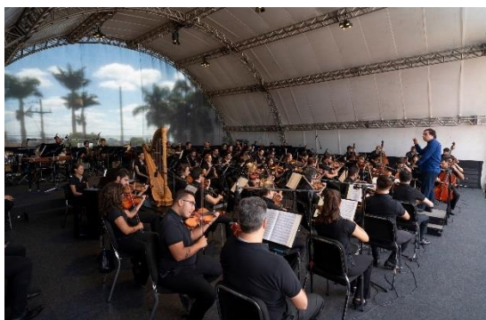
Praça 1