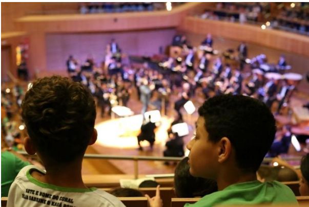
Didáticos 1 (24/05/2024)