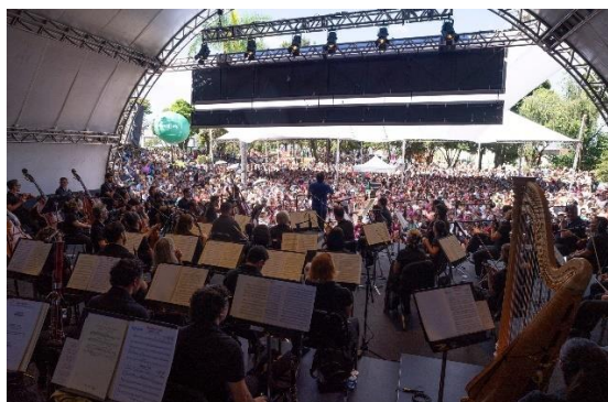
Praça 1, Foto: Eugênio Sávio