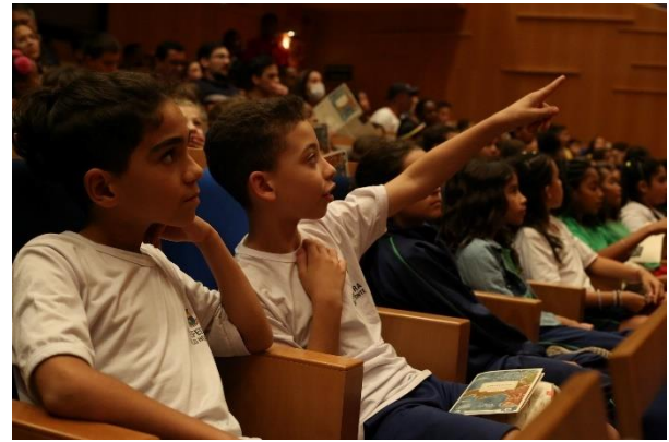
Didáticos 1 (24/05/2024)