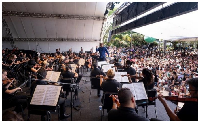
Praça 1, Foto: Eugênio Sávio

Abrimos os concertos gratuitos nas Praças Temporada 2024 na Praça do Glória, em Contagem. Realizamos também um concerto em homenagem ao dia das mães na Praça da Liberdade, em Belo Horizonte.