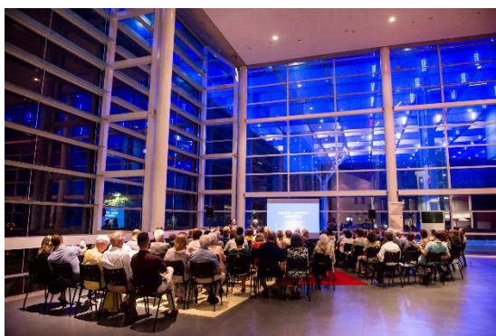
Comentados