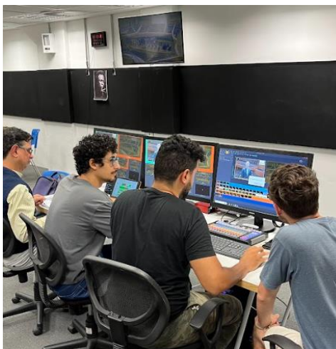
Equipe de transmissão