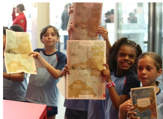
Didáticos 1 (Foto Flora Silberschneider, 24/05/2024)