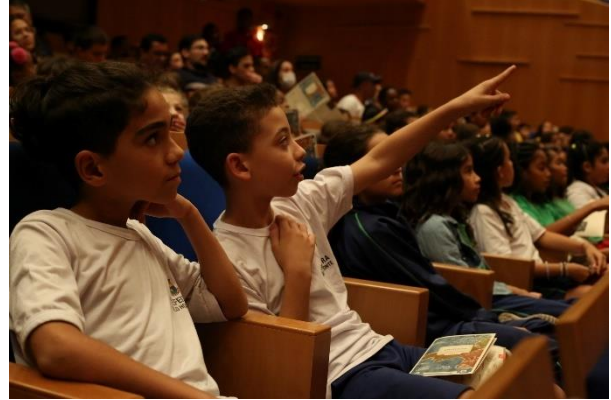
Didáticos 1