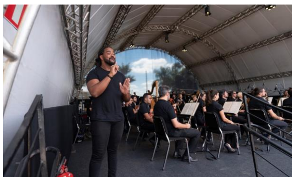
Praça 1, Foto: Eugênio Sávio