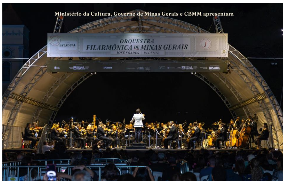
Araxá - Turnê 1

Nas cidades Itabirito, Belo Vale e Catas Altas a OFMG apresentou concertos com o grupo de Metais e Percussão, com um repertório que percorreu desde o jazz americano à música brasileira contemporânea.