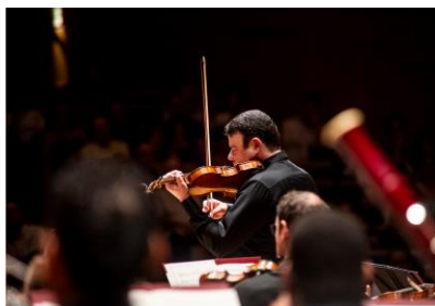
Vadim Gluzman