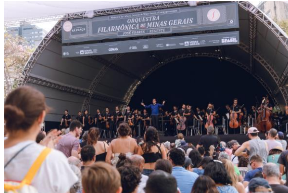
Praça 4

Clique aqui para ter acesso a fonte de comprovação do indicador.