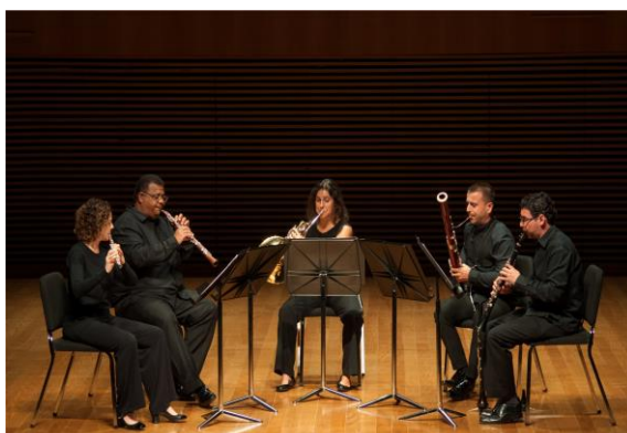
Filarmônica em Câmara 1 (Foto: Felipe Giubilei, 26/03/2024)