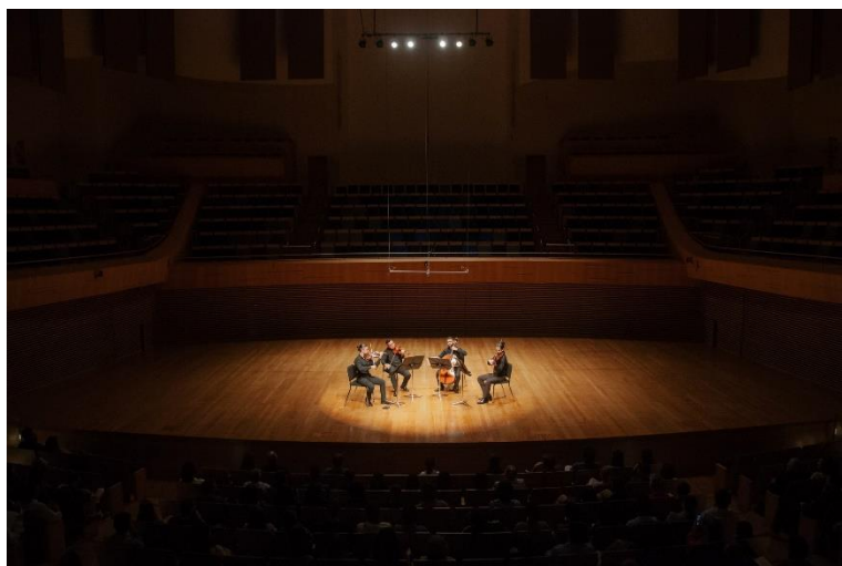
Filarmônica em Câmara 1

Clique aqui para ter acesso a fonte de comprovação do indicador.