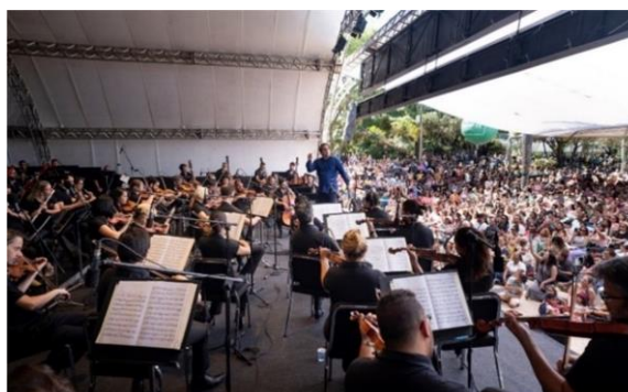
Praça 1