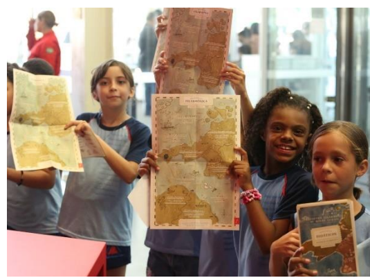
Didáticos 1 (Foto Flora Silberschneider, 24/05/2024)