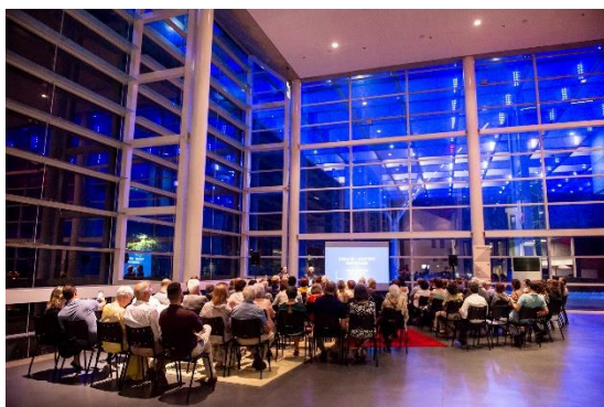
Comentados