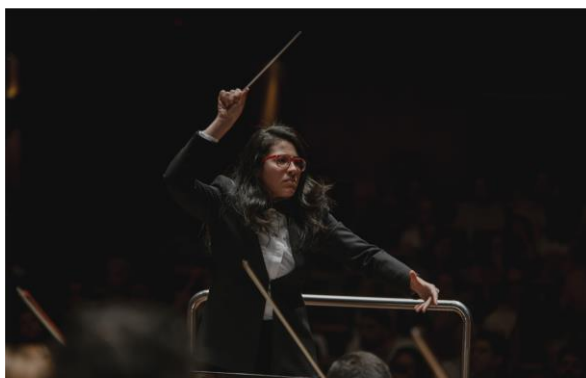
Laboratório de Regência, Foto: Bruna Brandão