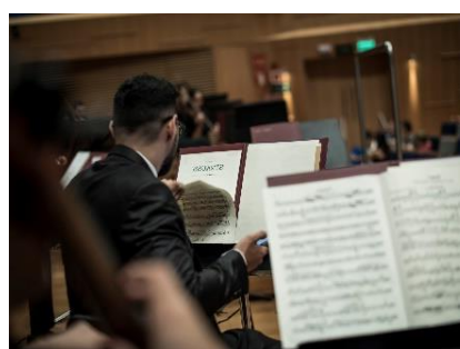
Fora de série 1 (Foto: Rafael Motta, 02/03/2024)

Clique aqui para ter acesso a fonte de comprovação do indicador.