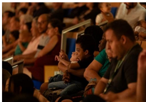
Juventude 1 (17/03/2024)

Clique aqui para ter acesso a fonte de comprovação do indicador.