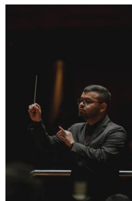
Laboratório de Regência

Clique aqui para ter acesso a fonte de comprovação do indicador.