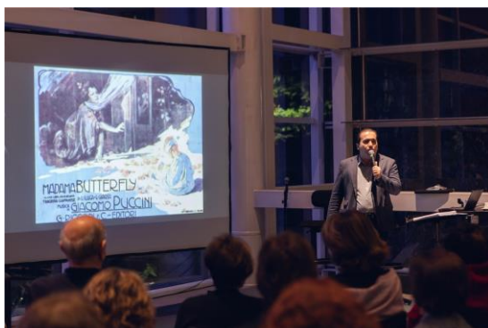
Comentados (Foto: Luciano Viana, 13/06/2024)