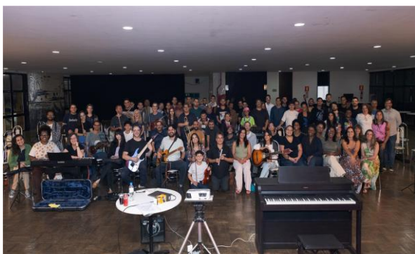
Intercâmbio - Turnê 1