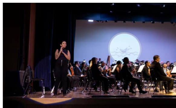
Didático - Turnê 1, Foto: Drigo Diniz

Clique aqui para ter acesso a fonte de comprovação do indicador.