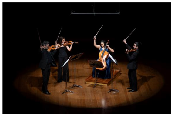
Filarmônica em Câmara 3

Clique aqui para ter acesso a fonte de comprovação do indicador.