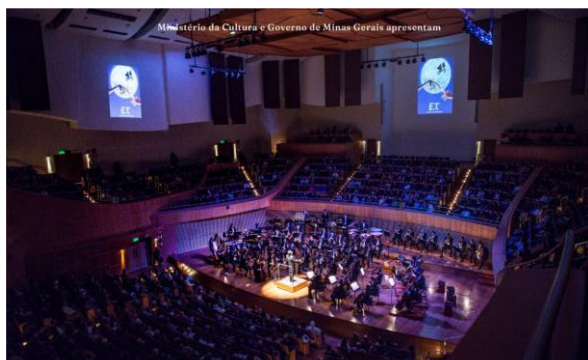
Especial 1