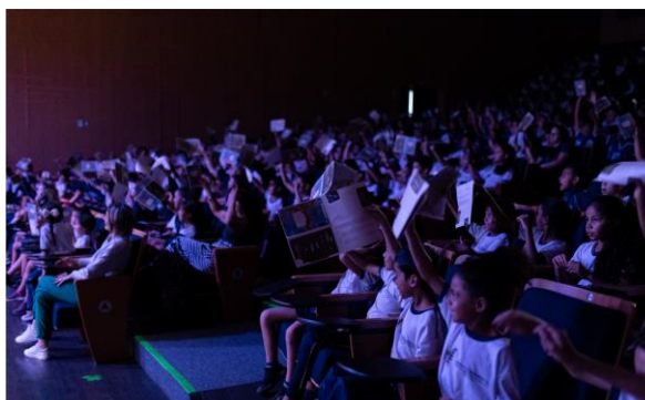
Didático - Turnê 1, Foto: Drigo Diniz