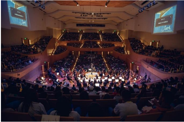
Didáticos 1 (Foto Luciano Viana, 24/05/2024)