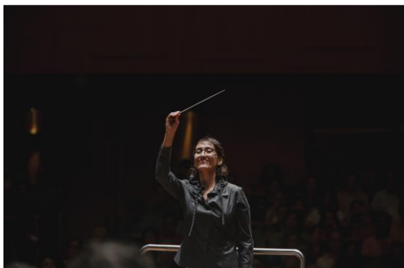
Laboratório de Regência