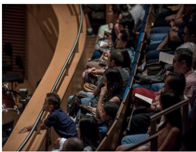
Fora de série 1 (Foto: Rafael Motta, 02/03/2024)