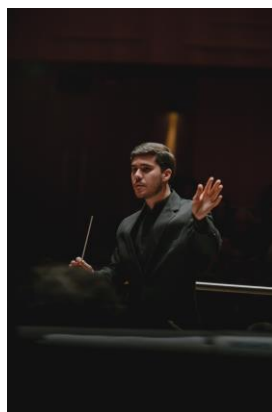
Laboratório de Regência