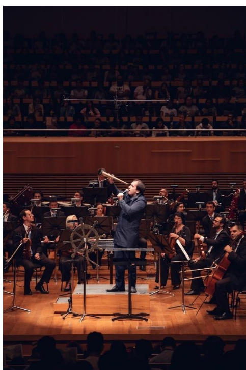
Didáticos 1 (Foto: Luciano Viana, 24/05/2024)

Clique aqui para ter acesso a fonte de comprovação do indicador.