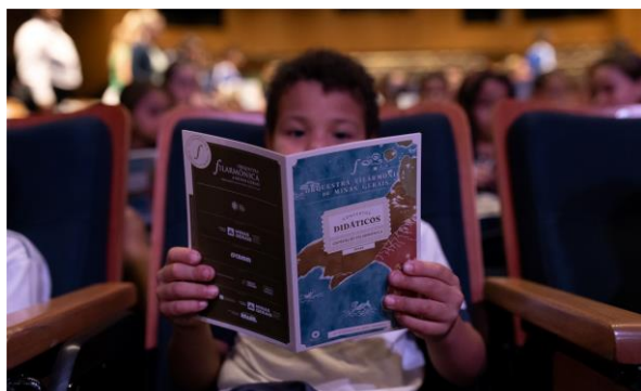
Didático - Turnê 1, Foto: Drigo Diniz