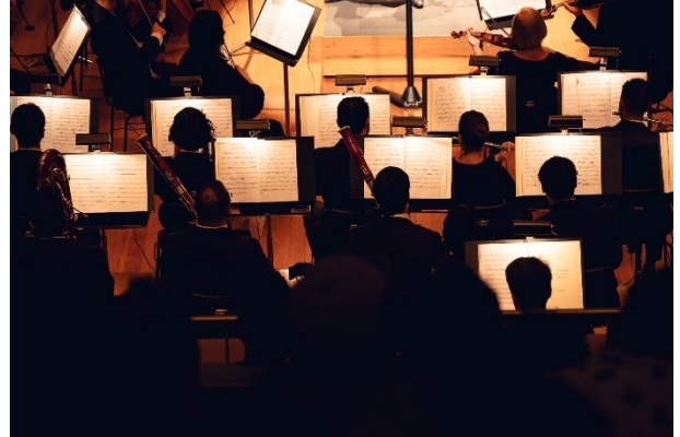
Didáticos 1 (Foto Luciano Viana, 24/05/2024)