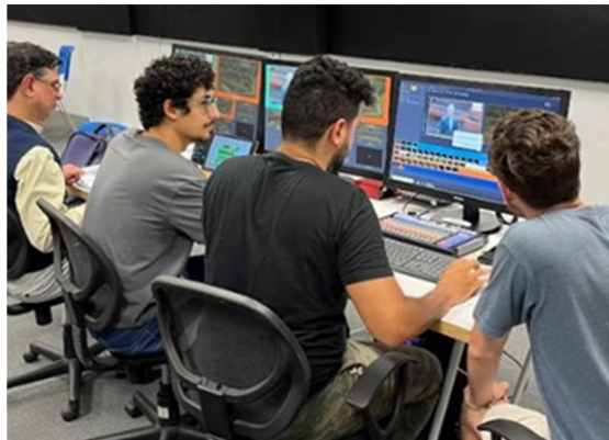
Equipe de transmissão