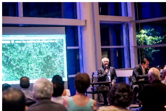
Comentados (Foto: Daniela Paoliello, 15/03/2024)