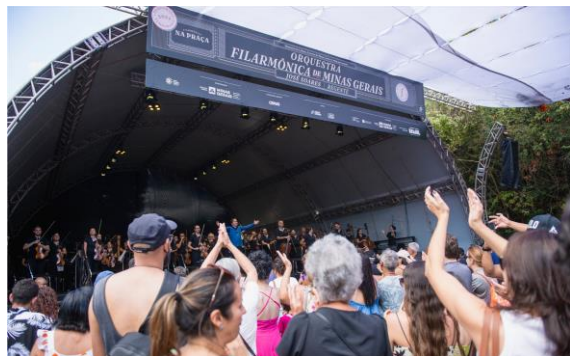
Praça 3