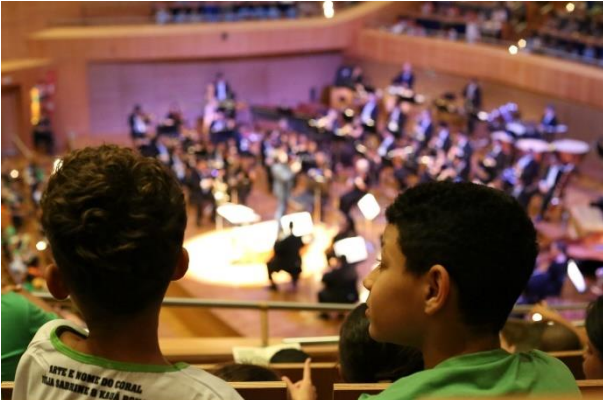
Didáticos 1