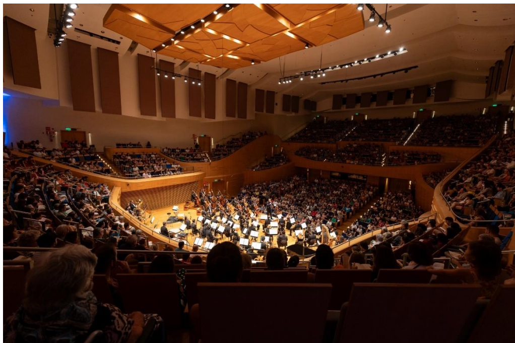
Juventude 1 (Foto: Rafael Motta, 17/03/2024)

Clique aqui para ter acesso a fonte de comprovação do indicador.