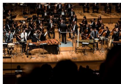
Grupo Martelo