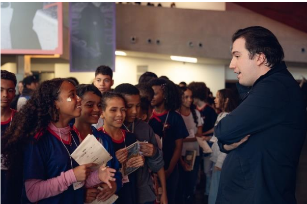
Didáticos 1 (Foto Luciano Viana, 24/05/2024)