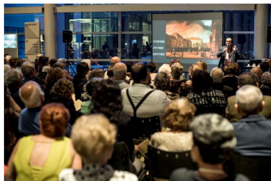
Comentados (Foto: Alexandre Rezende, 16/05/2024)