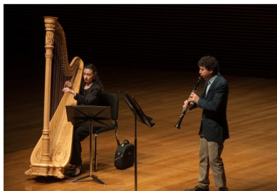
Filarmônica em Câmara 1 (Foto: Felipe Giubilei, 26/03/2024)