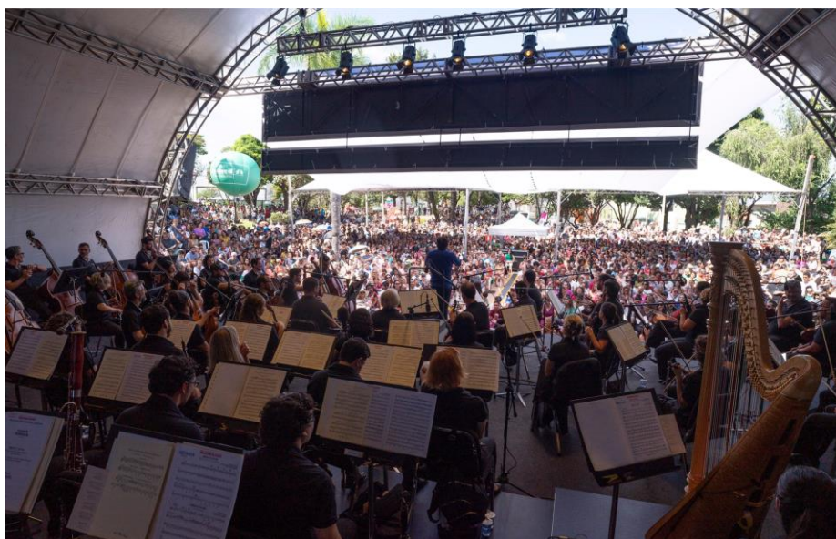
Praça 1

Clique aqui para ter acesso a fonte de comprovação do indicador.