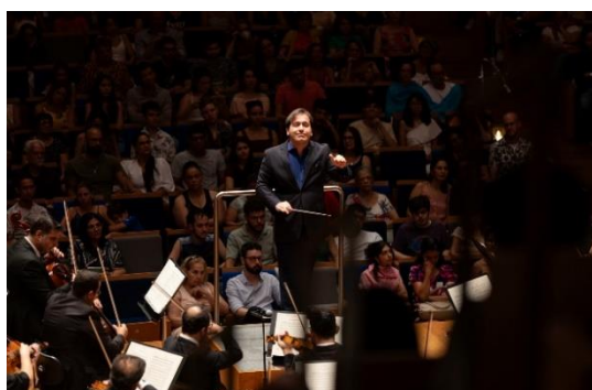
Juventude 1 (17/03/2024)