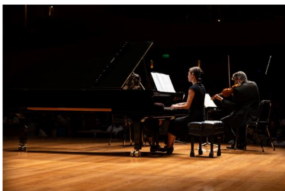
Filarmônica em Câmara 2 (Foto: Rafael Motta, 30/04/2024)