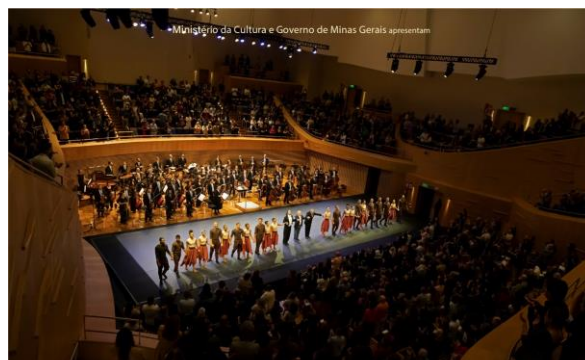
Especial 2 (Foto: José Luiz Pederneiras, 16/07/2024)