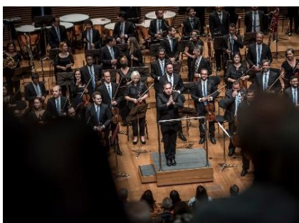
Fora de série 1 (Foto: Rafael Motta, 02/03/2024)