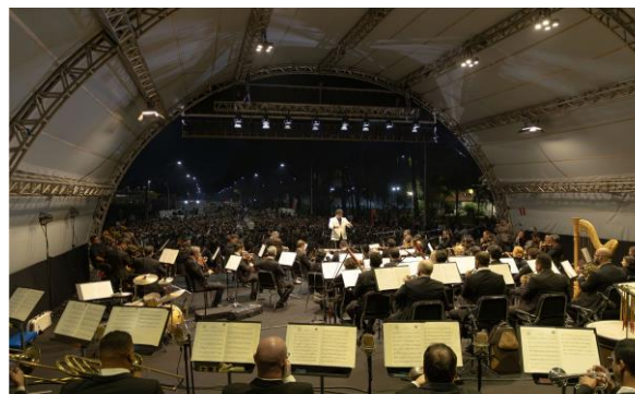
Uberlândia - Turnê 1, Foto: Drigo Diniz

Clique aqui para ter acesso a fonte de comprovação do indicador.