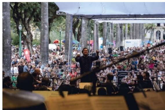
Praça 2