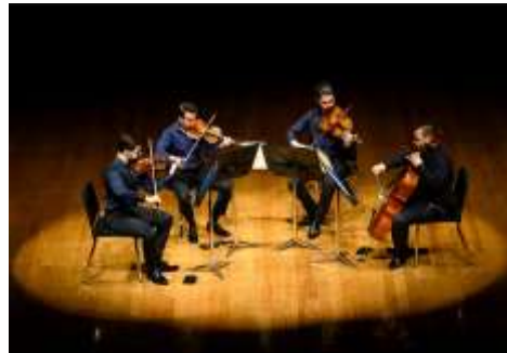
Filarmônica em Câmara 1

Clique aqui para ter acesso a fonte de comprovação do indicador.