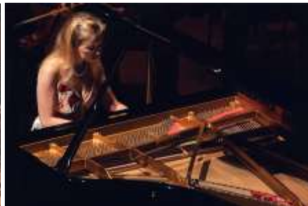
Natasha Paremski