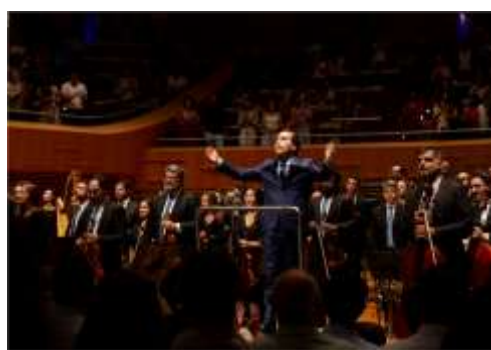
Juventude 1

Clique aqui para ter acesso a fonte de comprovação do indicador.