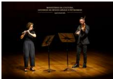
Filarmônica em Câmara 1