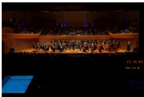
Juventude 1