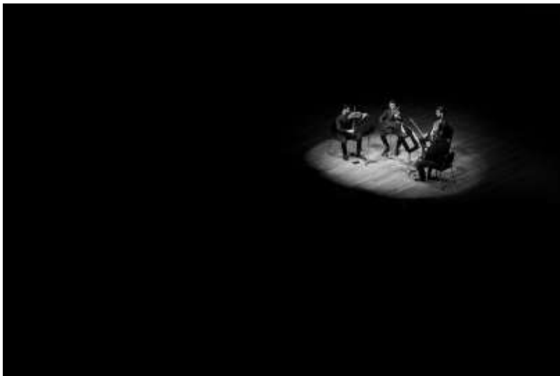
Filarmônica em Câmara 1

Clique aqui para ter acesso a fonte de comprovação do indicador.