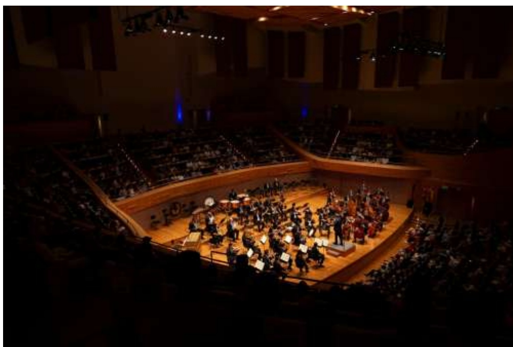
Juventude 1 (Foto: Tatiane Motta, 22/03/2026)

Clique aqui para ter acesso a fonte de comprovação do indicador.