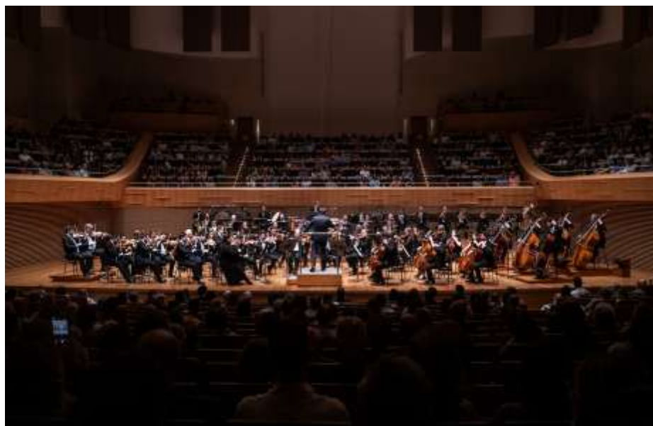
Fora de Série 1

Clique aqui para ter acesso a fonte de comprovação do indicador.